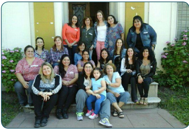
Imagen 4: Fuente 1° Reunión de constitución de la Red Nacional de TO. 22 y 23 de abril de 2016. San Miguel de Tucumán.

A partir de este encuentro y la conformación de la Red, se concretó la 2° reunión en septiembre del mismo año en la ciudad de Bahía Blanca con la intención de facilitar el acceso a las provincias patagónicas, organizada por la ABATO, el temario establecido fue: