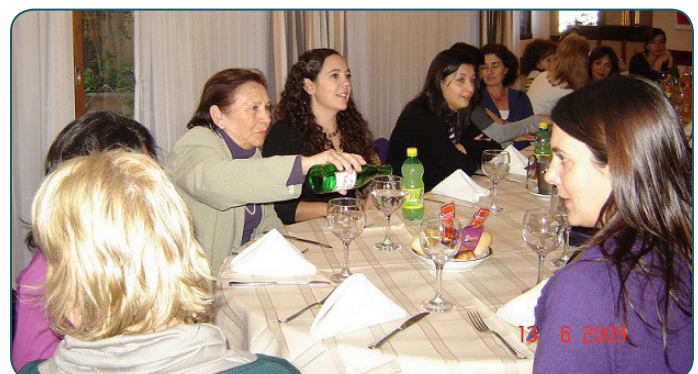
Imagen 3: Fuente Reunión de Asociaciones y Carreras de TO 13 de junio 2009. Ciudad de Córdoba.

En junio de 2009 se concretó una nueva reunión entre asociaciones y carreras de TO, donde la directora de la UNVM informó que la carrera de licenciatura en TO surgió en el año 2002 como una articulación con un instituto terciario que otorgaba una tecnicatura en Educación Especial y estimulación temprana del cual egresó solo una persona a esa fecha. Luego de cuatro años de convenio entre ambas instituciones, se observó que la formación de la tecnicatura tenía un fuerte énfasis pedagógico y no un enfoque socio sanitario, por lo que se presentó el proyecto de carrera de licenciatura en TO con desarrollo propio y en el año 2005 obtuvo la aprobación. También surgió otra vez el tema de la cobertura de cargos de TO por estudiantes y se planteó la escasa participación de colegas y estudiantes en las asociaciones. Se aclararon consultas sobre el tema de la rematriculación por Resolución 404/08 del Ministerio de Salud Nación; sobre propuestas de especialidades e inscripción en el Registro Nacional de Prestadores de OO.SS. Se propuso la organización de manera conjunta entre carreras y organizaciones de TO los festejos por el 50° Aniversario de TO en el país.